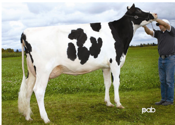
DUBOSQUET BOLTON DAISY